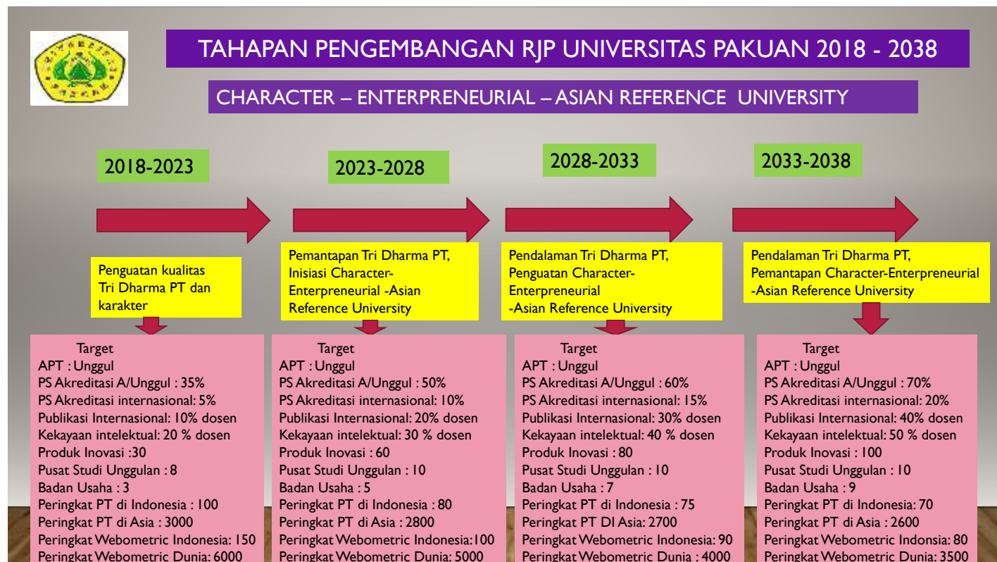
Gambar 1. Tahapan Pengembangan Jangka Panjang Universitas Pakuan

Untuk mencapai tujuan jangka panjang, dibuat dalam empat tahap pengembangan, yaitu tahap pertama (2018-2023) adalah tahap Penguatan Tri Dharma Perguruan Tinggi dan karakter. Tahap kedua (2023-2028) adalah tahap Pemantapan Tri Dharma Perguruan Tinggi dan Inisiasi Character-Enterpreneurial- Asian Reference University . Tahap ketiga (2028-2033), adalah tahap Pendalaman Tri Dharma Perguruan Tinggi dan Penguatan Character-Enterpreneurial- Asian Reference University . Tahap keempat (2033-2038) adalah tahap Pendalaman Tri Dharma Perguruan Tinggi dan Pemantapan Character-Enterpreneurial- Asian Reference University . Berikut ini Bagan Tahapan Pengembangan Rencana Jangka Panjang (RJP) Universitas Pakuan